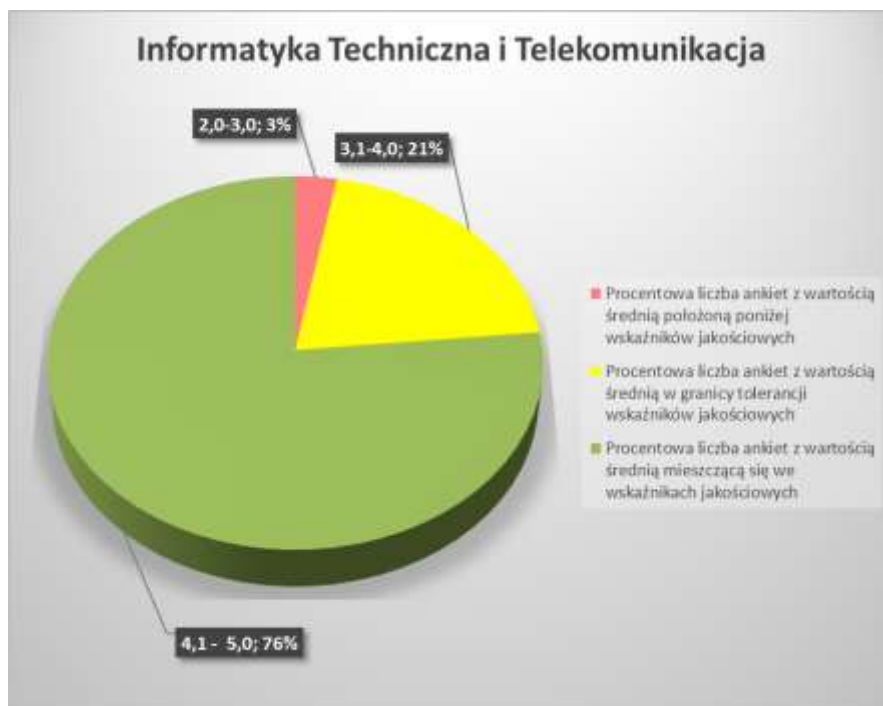
Rys 1. Sumaryczny rozkład procentowy ocen dla Dziekanatu obsługującego dyscyplinę Informatyka Techniczna i Telekomunikacja